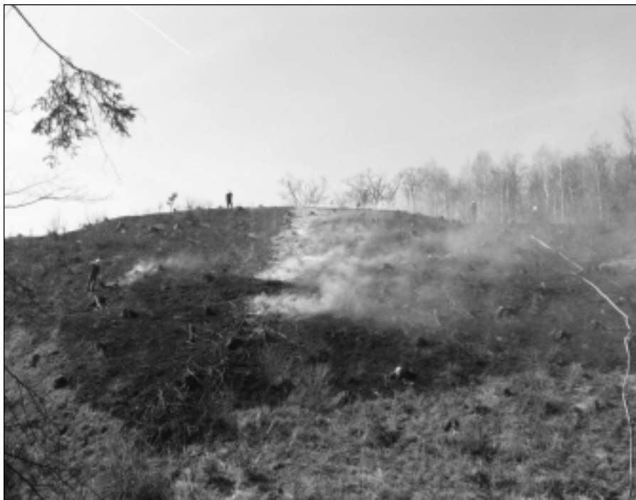
Požár v Rékovi 3. dubna 2005