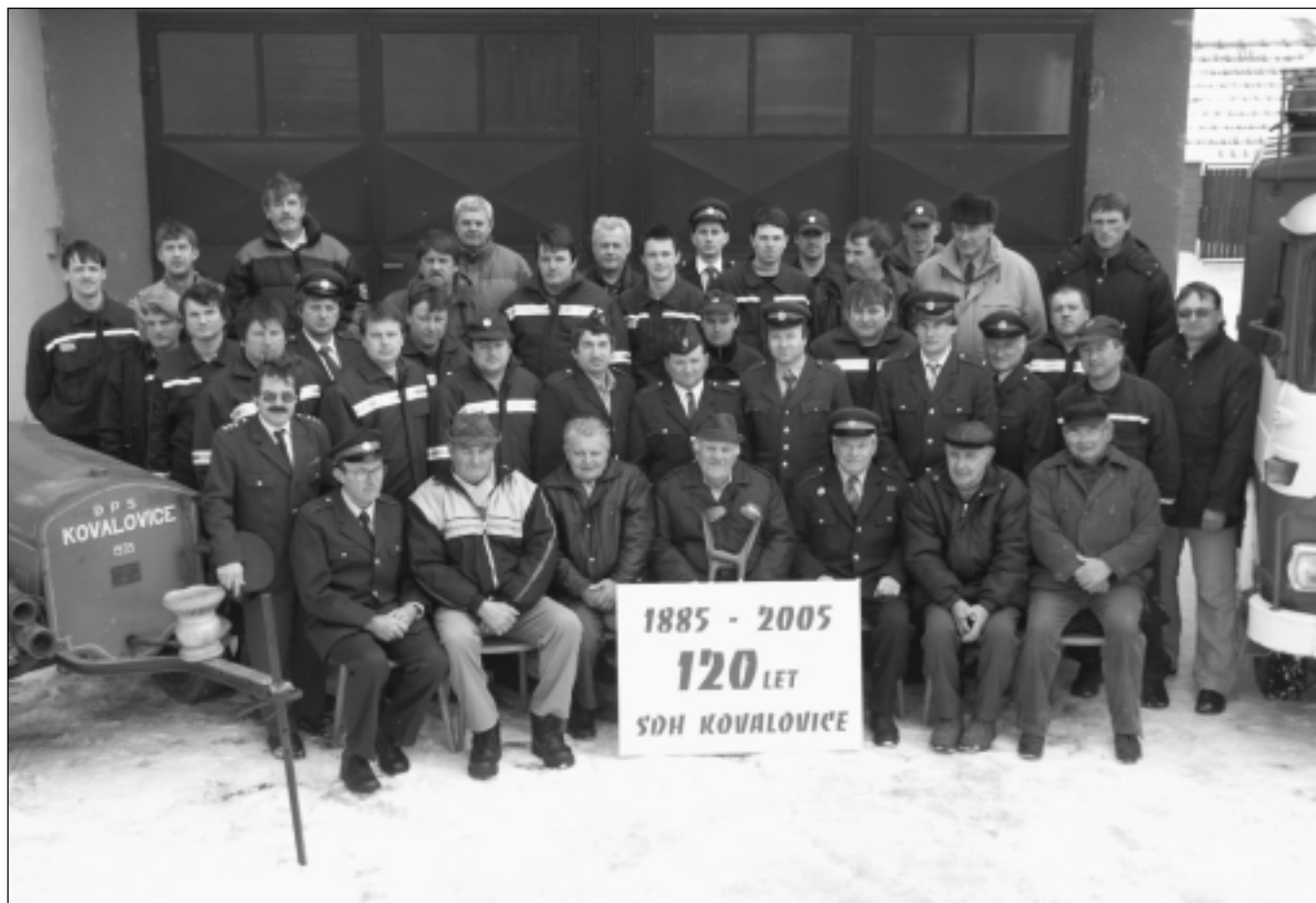
Společná fotografie členů SDH v březnu 2005