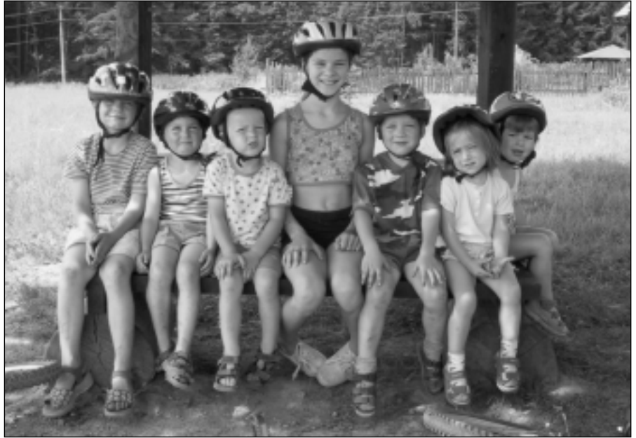
Nepostradatelnou cyklistickou výbavou při poznávání našeho okolí je přilba

čujete dále po modré údolím Říčky, v této části zvané Mariánské nebo také Lišeňské. Cestou máte možnost se vykoupat ve 3 rybnících. V rybníce u chaty Muška to nedoporučuji – je zde zřízena