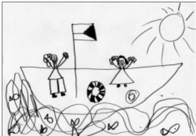
Kreslila Martinka Lvová - 5 roků

Nejprve bych chtěla poděkovat všem, kteří se podíleli na rekonstrukci kuchyně a přispěli tak k jejímu uvedení do provozu 1. září. Stejně poděkování si zaslouhují i maminky, které nám před začátkem školního roku pomohly s velkým úklidem, který je po podobných akcích nezbytný. Díky ochotě a spolupráci obecního úřadu a mnoha dalších lidí tak děti 1. září přišly do mateřské školy s novou kuchyní, novými dětskými toaletami a mnoha dalšími úpravami.