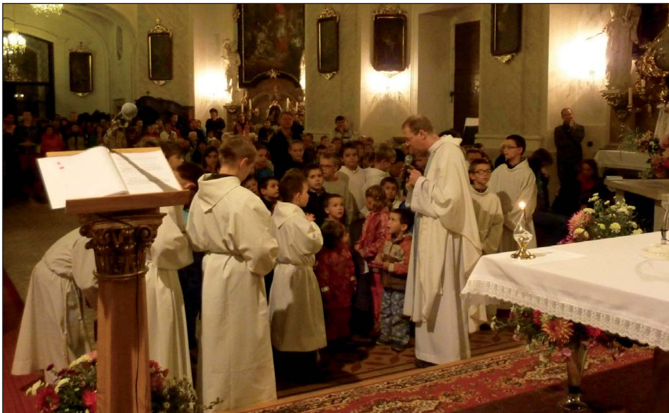
letošní farní pouť do Sloupa