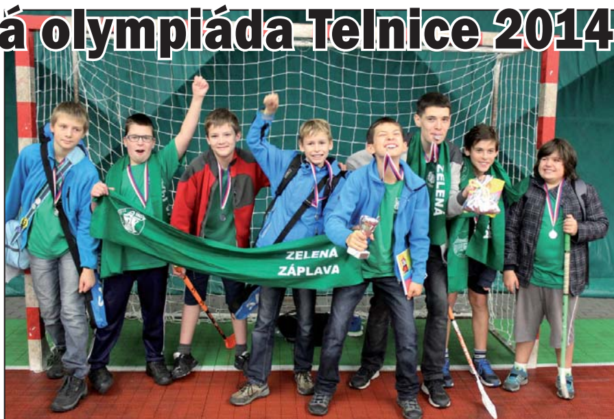
Pošukov B obsadil 3. místo