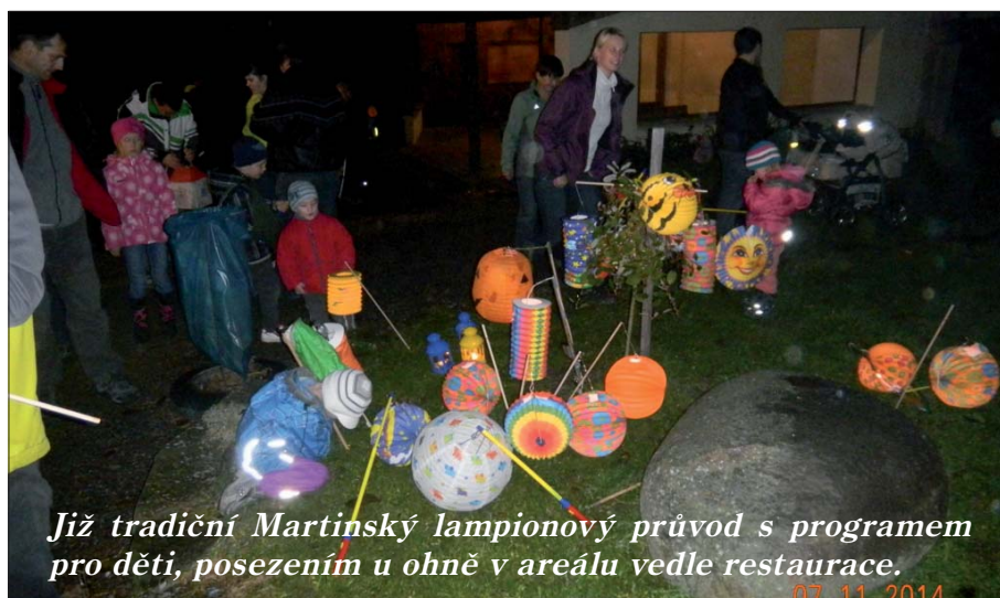
Již tradiční Martinský lampionový průvod s programem pro děti, posezením u ohně v areálu vedle restaurace.

Příjemné chvíle s knížkou vám přeje Milada Terberová