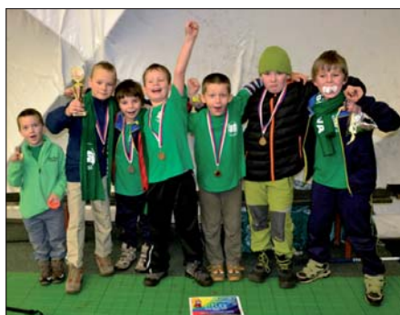
Pošukov B obsadil 3. místo