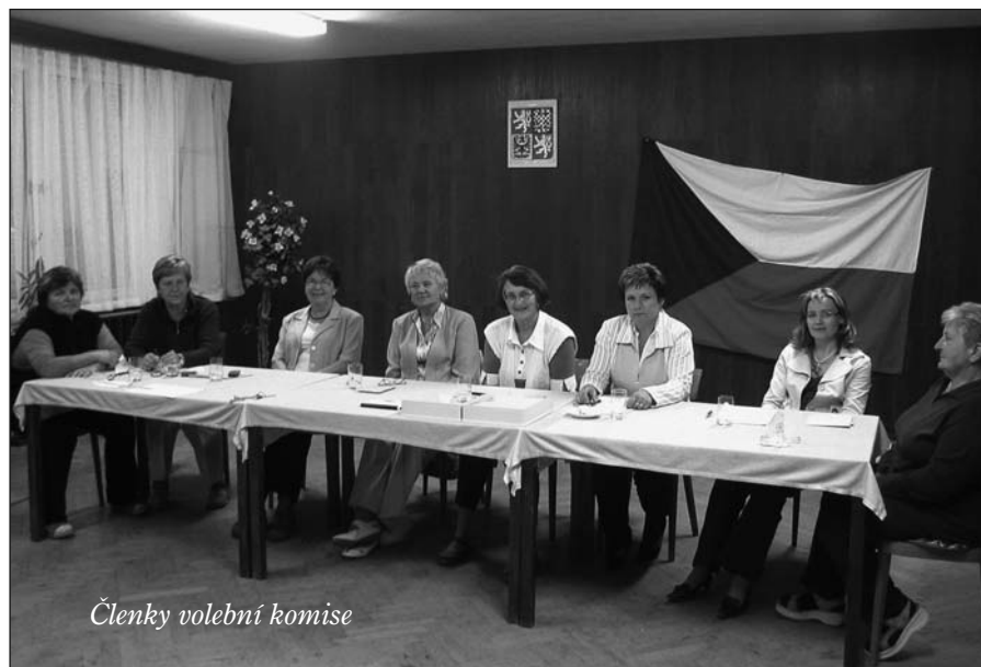
Členky volební komise