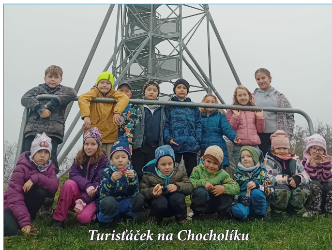
Turistáček na Chocholíku