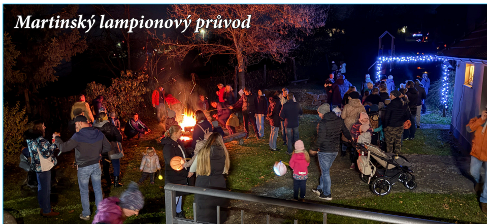
Martinský lampionový průvod